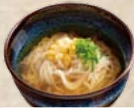
生そうめん・うどん・そば ◆冷製もしくは温製からお選びください。 ミニ 250円 並盛 450円 てんこ盛 500円