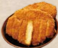
とんかつ 1枚 肩 540円 背 420円 とんかつ 3枚 肩 1,480円 背 1,200円